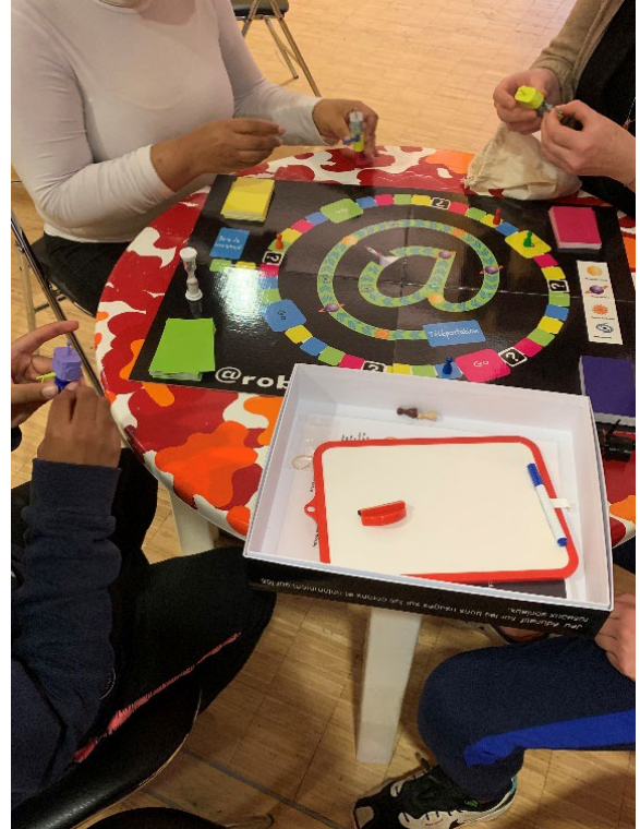
Intervention par le jeu à Ergué Armel